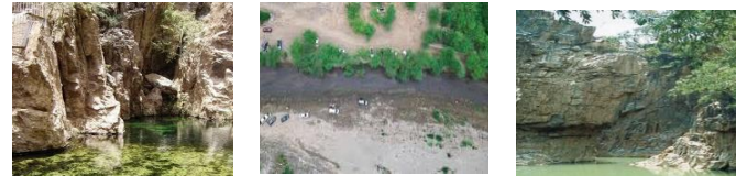
(بني مالك شكل ٢) (العارضه شكل ٣) ( الخويبة شكل ٤ )

*الصور التي توضح أماكن مختلفة للعيون الحارة في منطقة جازان شكل رقم (٣ و ٢ و ١)