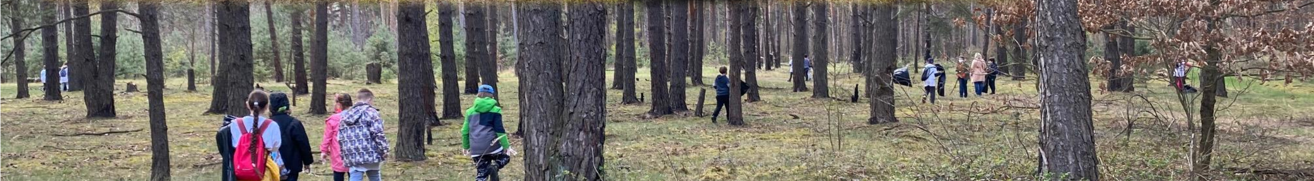
Nature Cleaning, Earth Day Protected landscape area Záhorie - Bezedné