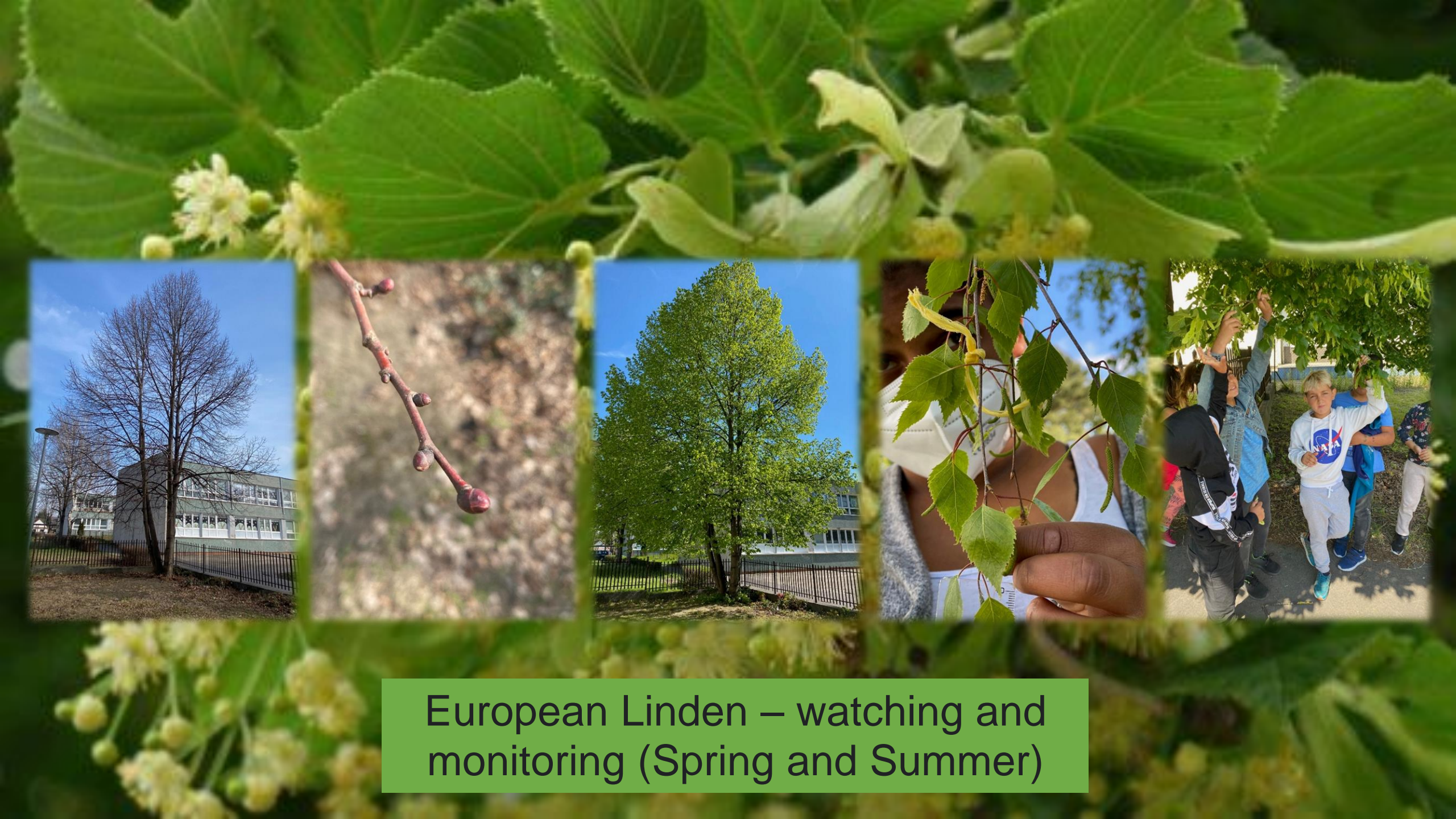
European Linden – watching and monitoring (Spring and Summer)