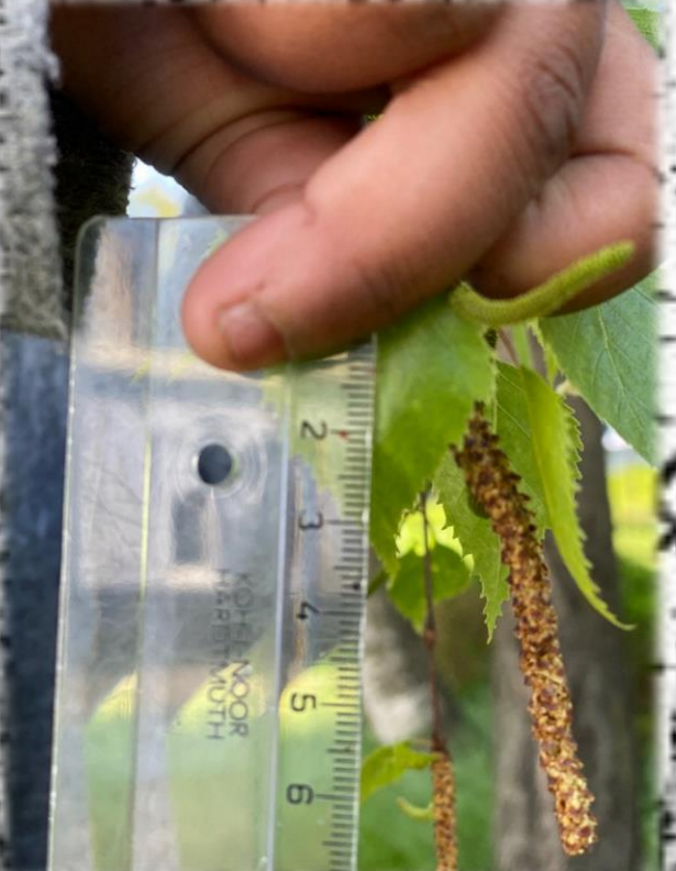
Birch – watching and monitoring (Spring and Summer)