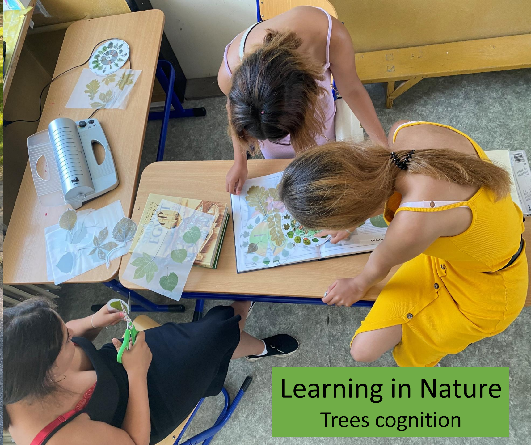
Learning in Nature Trees cognition