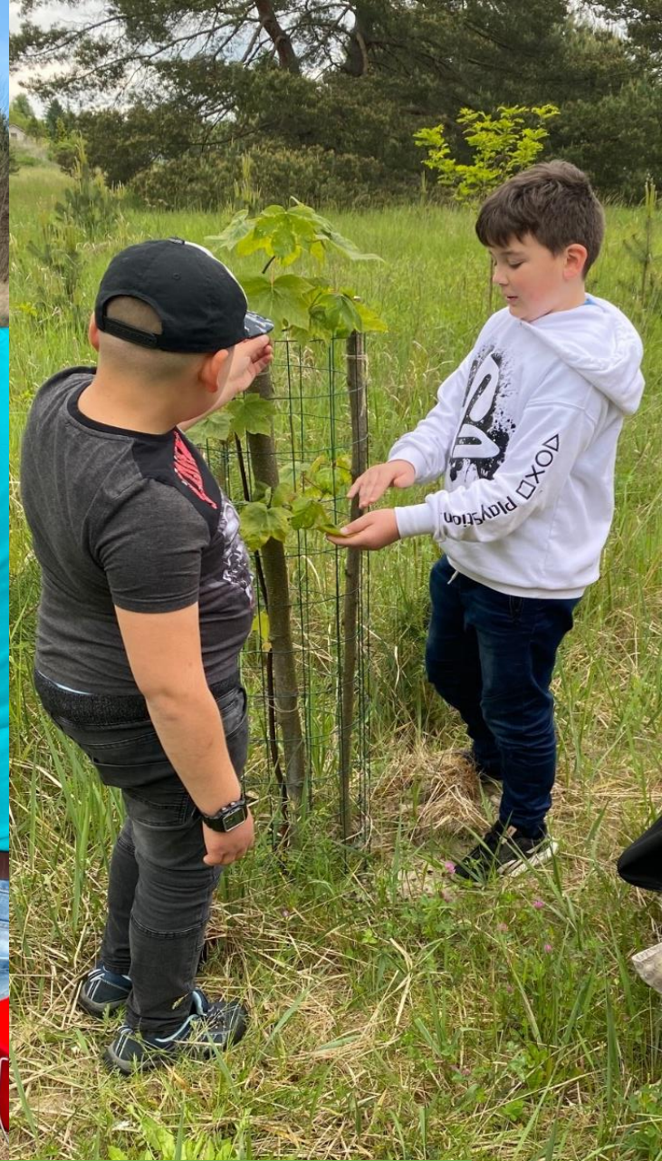
Watching and monitoring of trees phenology phases