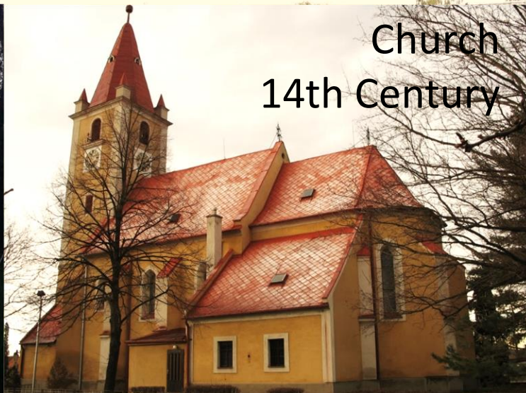
Church 14th Century