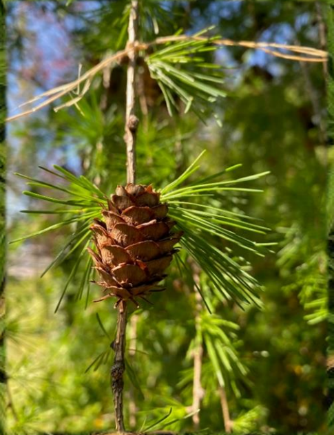
Spruce – watching and monitoring (Spring and Summer)