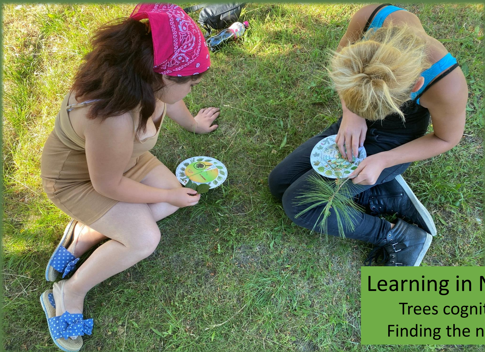
Learning in Nature Trees cognition Finding the names